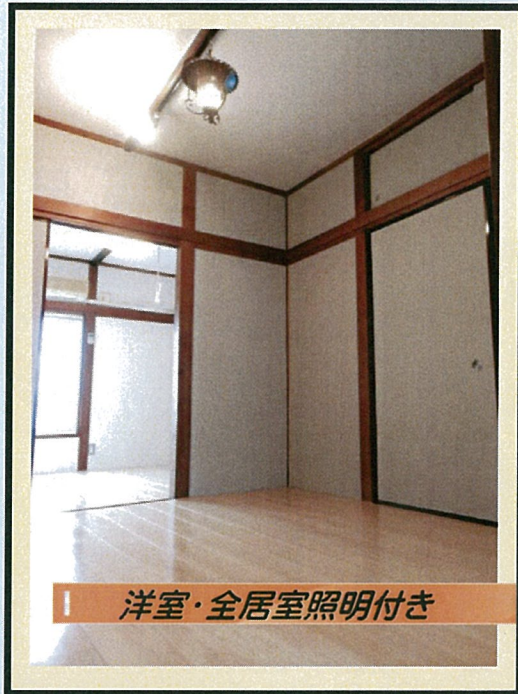
洋室・全居室照明付き