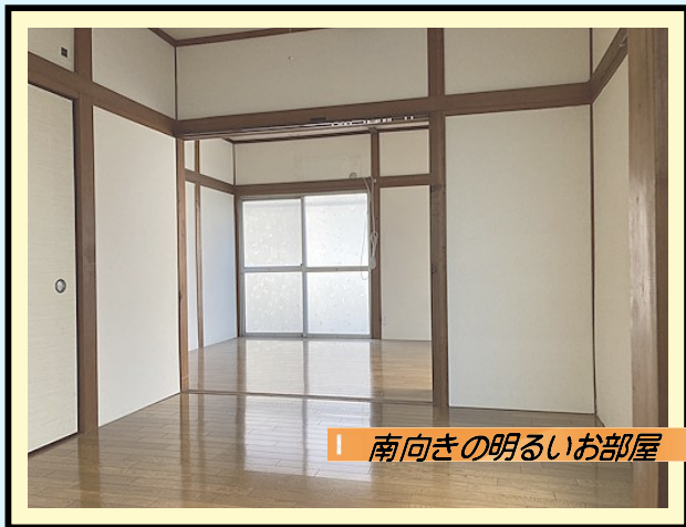
南向きの明るいお部屋