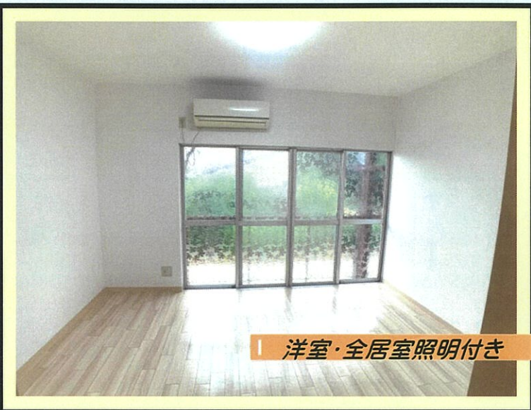
洋室・全居室照明付き