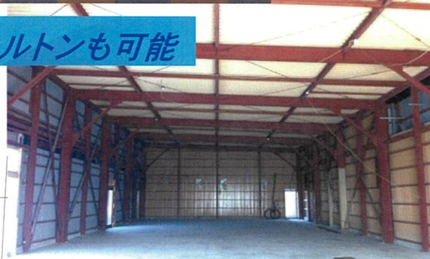
スケルトンも可能