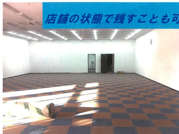
店舗の状態が残すことも可能